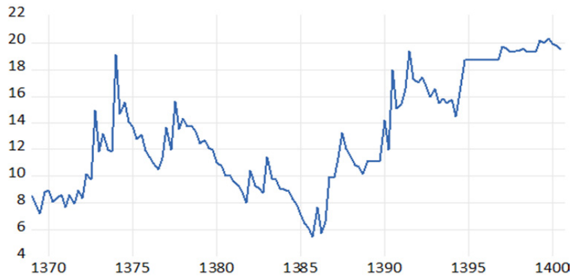
نمودار ۱. نوسانات نرخ ارز